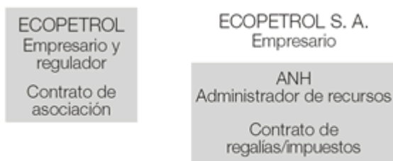
Figura 1. Nueva estructura

Con el propósito de mejorar y clarificar el desempeño del Estado en la industria del petróleo, y aumentar las actividades de exploración y producción, el Gobierno de Colombia ha efectuado dos cambios fundamentales en el negocio de exploración y producción de petróleo y gas, como sigue: